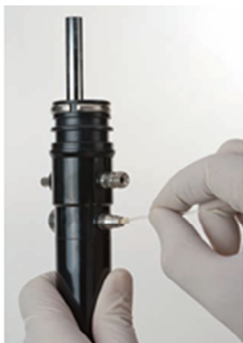
( 1 )