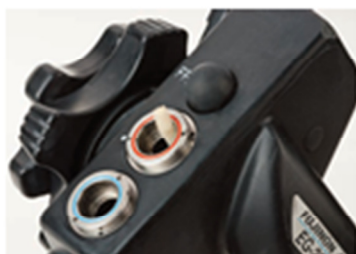
( 4 )