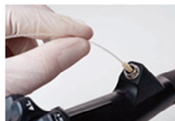
( 3 )