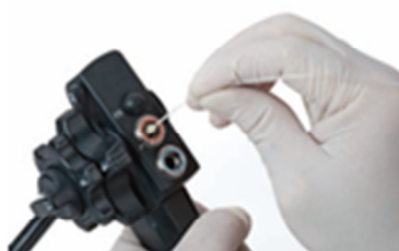
( 2 )