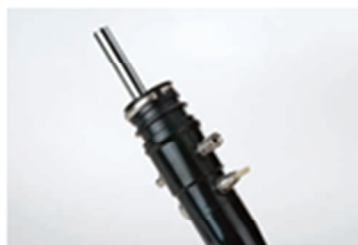
( 5 )