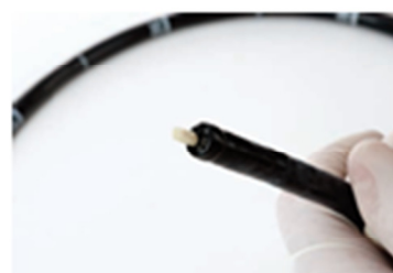
( 6 )

Το Test Instrusponge διατίθεται σε διαφορετικά μεγέθη και διαμέτρους που καλύπτουν όλα τα αυλοειδή εργαλεία, τα εύκαμπτα και τα άκαμπτα ενδοσκόπια.